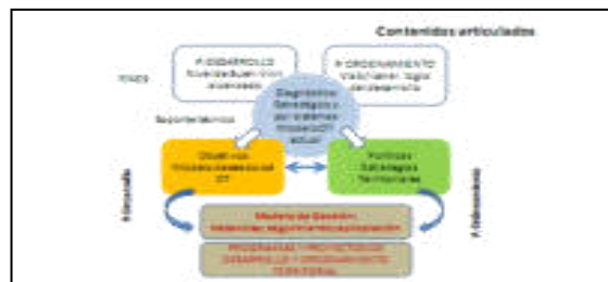
Gráfico No. 1 Contenidos Articulados