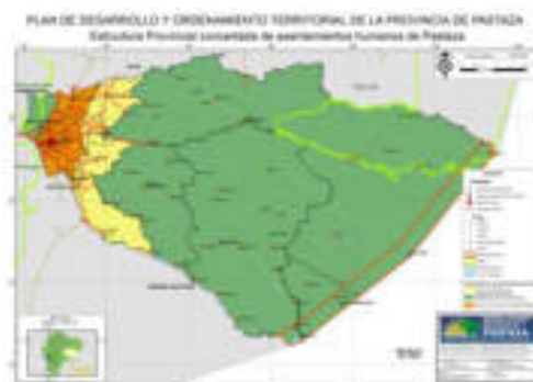
Gráfico No. 4 Estructura Provincial de Asentamientos Humanos de la Provincia de Pastaza

*Este gráfico es una reducción del Mapa N° 32 del Anexo 1