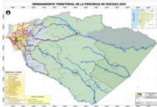
Gráfico No. 5 Modelo de Ordenamiento Territorial de la Provincia de Pastaza al 2025

Elaboración: Dirección de Planificación del GADPPz