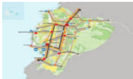
Gráfico No. 2 Estrategia Territorial Nacional

Fuente: SENPLADES, 2009 Elaboración: SENPLADES