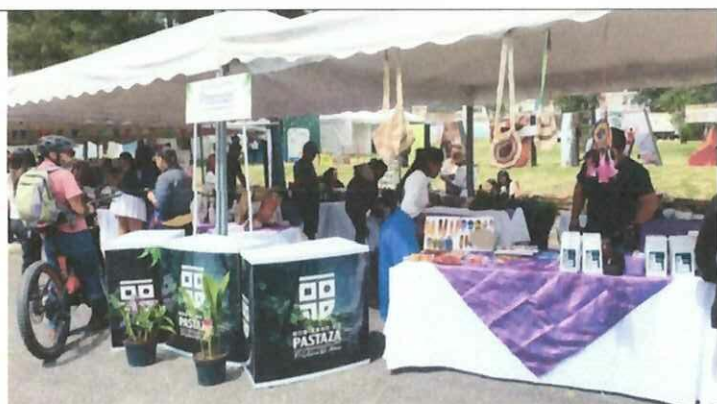
Actividad: Feria de emprendimientos "CHILLO FEST 2025". Fecha: 03-05 diciembre del 2025 Lugares: Valle de los Chillos, parque Acosta Soberón