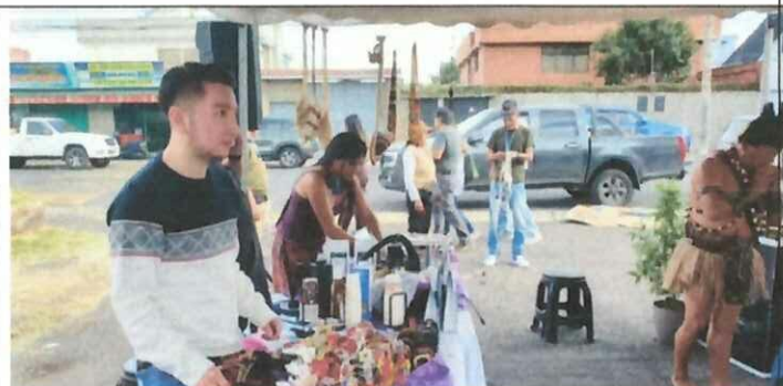
Actividad: Feria de emprendimientos "CHILLO FEST 2025". Fecha: 03-05 diciembre del 2025 Lugares: Valle de los Chillos, parque Acosta Soberón