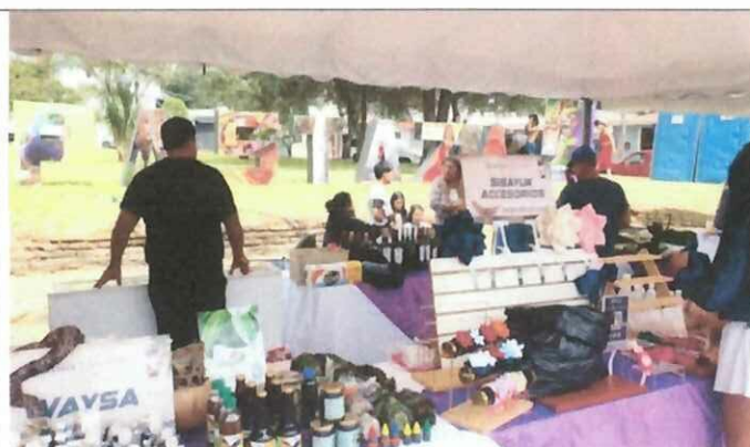
Actividad: Feria de emprendimientos "CHILLO FEST 2025". Fecha: 03-05 diciembre del 2025 Lugares: Valle de los Chillos, parque Acosta Soberón