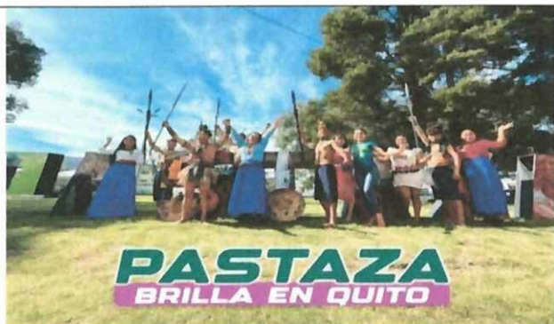
Actividad: Feria de emprendimientos "CHILLO FEST 2025". Fecha: 03-05 diciembre del 2025 Lugares: Valle de los Chillos, parque Acosta Soberón