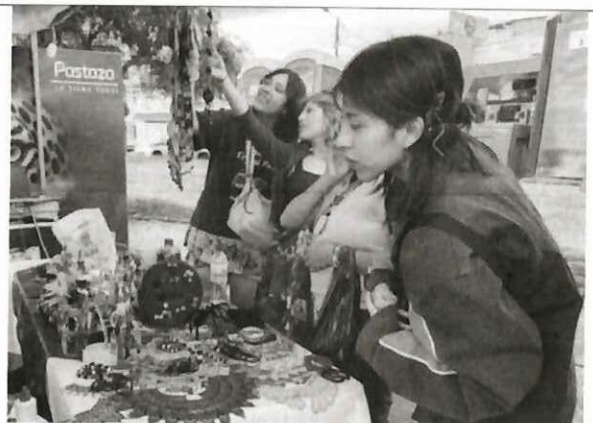
Actividad: Feria de emprendimientos "CHILLO FEST 2025". Fecha: 03-05 diciembre del 2025 Lugares: Valle de los Chillos, parque Acosta Soberón