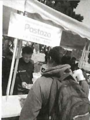
Actividad: Feria de emprendimientos "CHILLO FEST 2025". Fecha: 03-05 diciembre del 2025 Lugares: Valle de los Chillos, parque Acosta Soberón