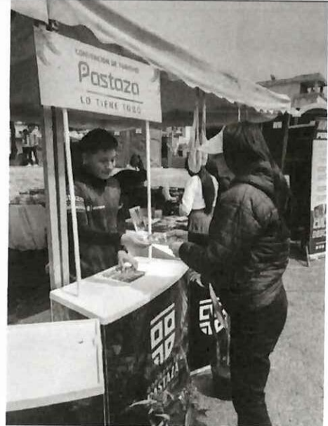
Actividad: Feria de emprendimientos "CHILLO FEST 2025". Fecha: 03-05 diciembre del 2025 Lugares: Valle de los Chillos, parque Acosta Soberón