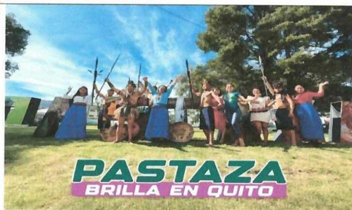
Actividad: Feria de emprendimientos "CHILLO FEST 2025". Fecha: 03-05 diciembre del 2025 Lugares: Valle de los Chillos, parque Acosta Soberón