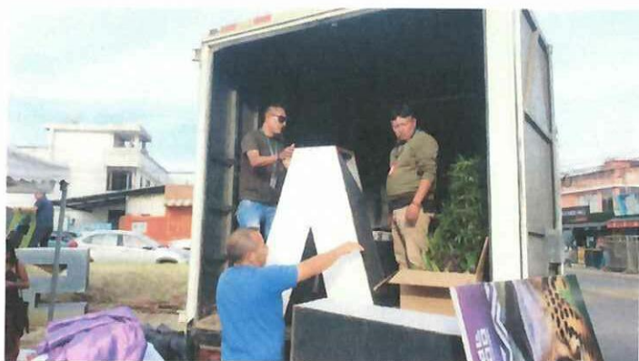
Actividad: Feria de emprendimientos "CHILLO FEST 2025". Fecha: 03-05 diciembre del 2025 Lugares: Valle de los Chillos, parque Acosta Soberón