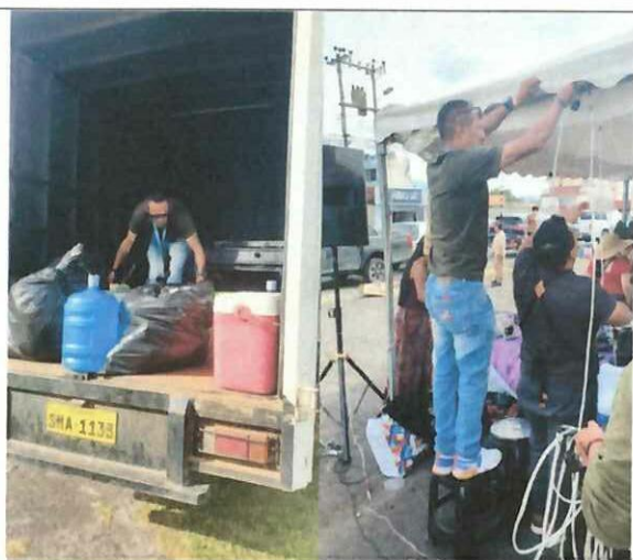
Actividad: Feria de emprendimientos "CHILLO FEST 2025". Fecha: 03-05 diciembre del 2025 Lugares: Valle de los Chillos, parque Acosta Soberón