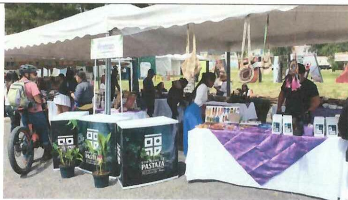
Actividad: Feria de emprendimientos "CHILLO FEST 2025". Fecha: 03-05 diciembre del 2025 Lugares: Valle de los Chillos, parque Acosta Soberón