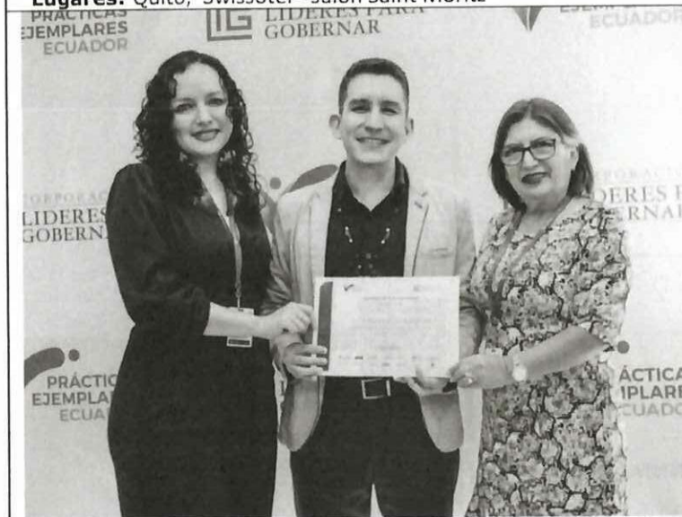
Actividad: Concurso de Prácticas Ejemplares Ecuador 2025. Fecha: 19 de noviembre del 2025 Lugares: Quito, Swissôtel - salón Saint Moritz