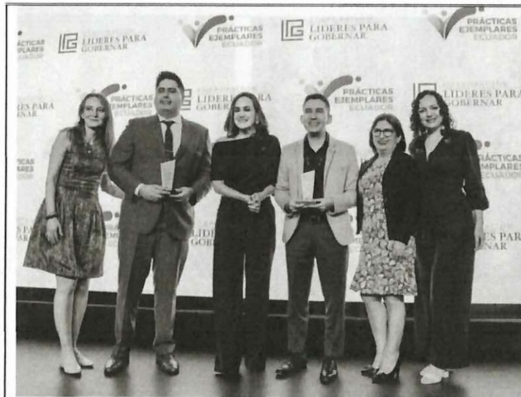
Actividad: Concurso de Prácticas Ejemplares Ecuador 2025. Fecha: 19 de noviembre del 2025 Lugares: Quito, Swissôtel - salón Saint Moritz