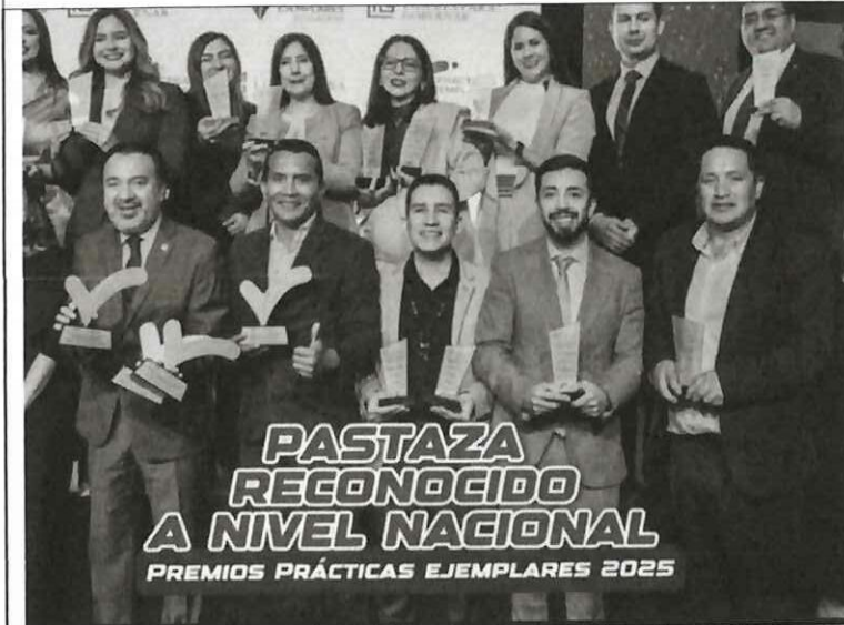
Actividad: Concurso de Prácticas Ejemplares Ecuador 2025. Fecha: 19 de noviembre del 2025 Lugares: Quito, Swissôtel - salón Saint Moritz