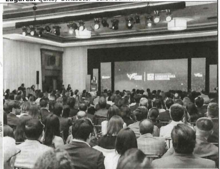
Actividad: Concurso de Prácticas Ejemplares Ecuador 2025. Fecha: 19 de noviembre del 2025 Lugares: Quito, Swissôtel - salón Saint Moritz