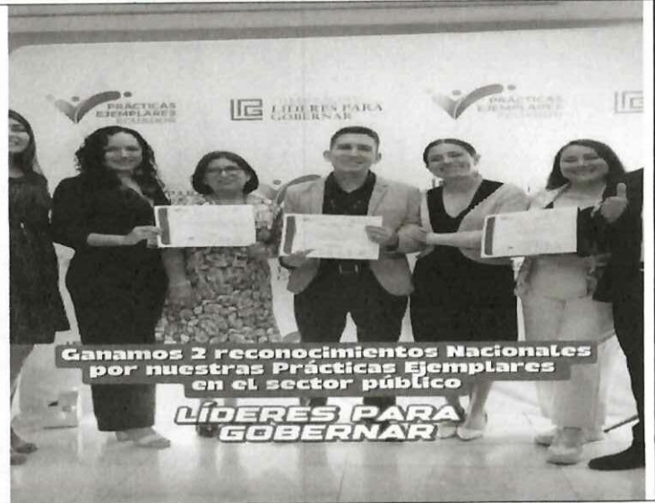
Actividad: Concurso de Prácticas Ejemplares Ecuador 2025. Fecha: 19 de noviembre del 2025 Lugares: Quito, Swissôtel - salón Saint Moritz