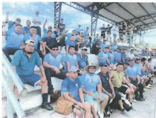
6.2.- Anexo: Listado de participantes