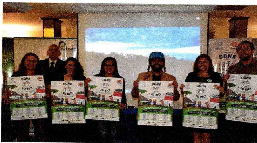
PRESENTACIÓN DEL LOGO Y AFICHE DE LA CAMPAÑA "DONA TU BICI"

EN COMPANÍA DE LOS REPRESENTANTES DE LA FUNDACION CAVAT, NATURALEZA CULTURA INTERNACIONAL (NCI), ADEMAS LOS DISTINTOS COLECTIVOS COMO SON: TOP BIKE ECUADOR, CICLEADAS EL REY, CICLOPOLIS.