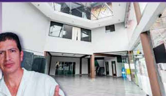
Pintura de hall