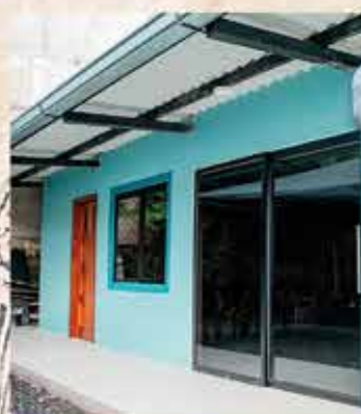
Construcción de camerinos