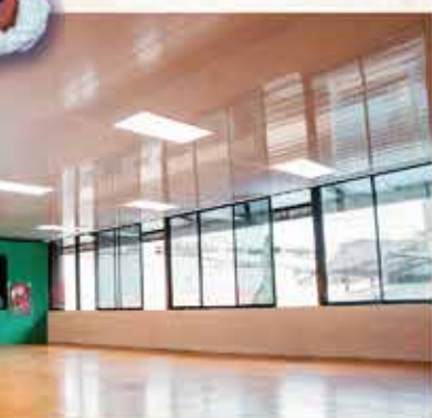
Construcción aula de teatro